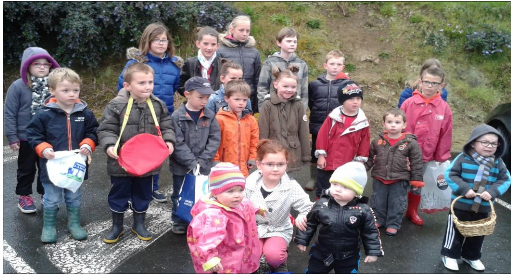
La chasse à l'oeuf

En cette année 2014, notre Comité des Fêtes a organisé les deux manifestations traditionnelles dans notre commune. Toutefois, le Dimanche de Pâques, nous avons souhaité faire plaisir aux enfants de plus en plus nombreux, en les invitant à participer à une chasse aux œufs. Elle s'est déroulée dans notre Salle Ker Héol, vu le mauvais temps qui régnait à l'extérieur. Nous avons également récompensé les parents qui les accompagnaient en leur offrant l'apéritif.